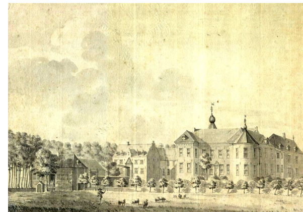
Kasteel Huys ter Horst (tekening Jan de Beijer 1738)

Kasteel Huys ter Horst Kasteellaan 2 Horst