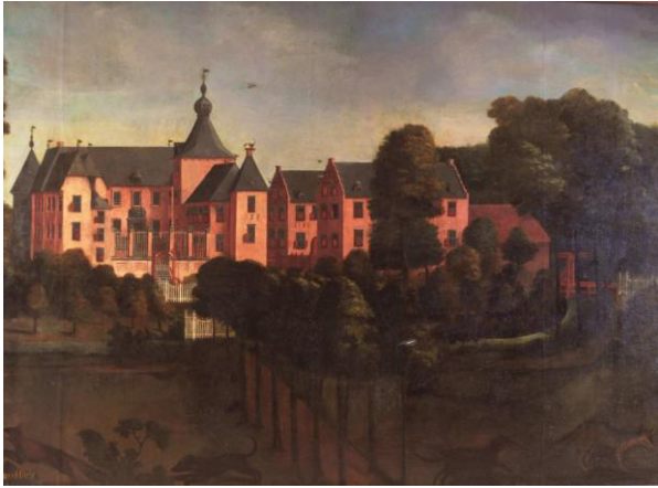
Kasteel Huys ter Horst na 1758

Het kasteel Huys ter Horst was in de 17e eeuw een van de grootste kastelen van Zuid-Nederland en is in de 19e eeuw vervallen tot een ruïne. Na jarenlang hard werken door een groep enthousiaste vrijwilligers wordt het publiek weer toegelaten tot de kasteelruïne van Horst.