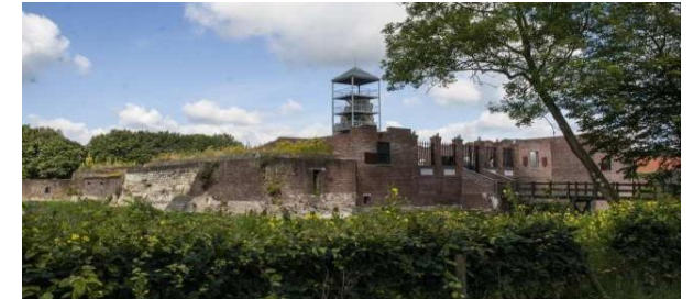
Ruïne Kasteel Huys ter Horst 2016