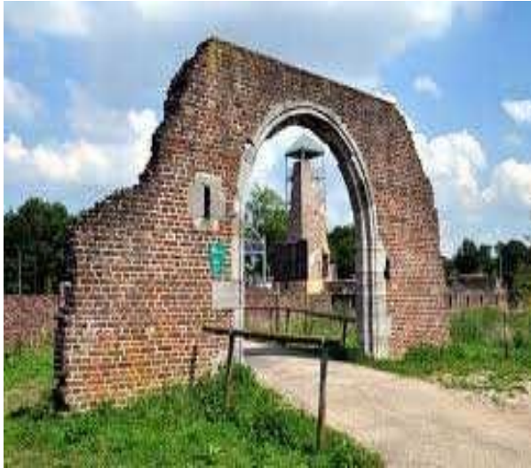
Toegangspoort van de voormalige Hof ter Binnen

Kasteel Huys ter Horst heeft verschillende bewoners gekend. Het geslacht Van der Horst, het geslacht Van Myrlaer, het geslacht Van Broekhuizen. Allemaal hebben ze hun stempel gedrukt op het uiterlijk en de omgeving van het kasteel.