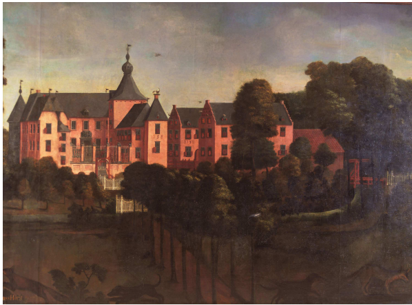
Kasteel Huys ter Horst na 1758

Het kasteel Huys ter Horst was in de 17e eeuw een van de grootste kastelen van Zuid-Nederland en is in de 19e eeuw vervallen tot een ruïne. Vanaf 1840 werd het kasteel ontmanteld en grotendeels als bouwmaterialen verkocht.