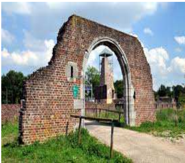
Toegangspoort van de voormalige Hof ter Binnen

Kasteel Huys ter Horst heeft verschillende bewoners gekend. Het geslacht Van der Horst, het geslacht Van Myrlaer, het geslacht Van Broekhuizen. Allemaal hebben ze hun stempel gedrukt op het uiterlijk en de omgeving van het kasteel.