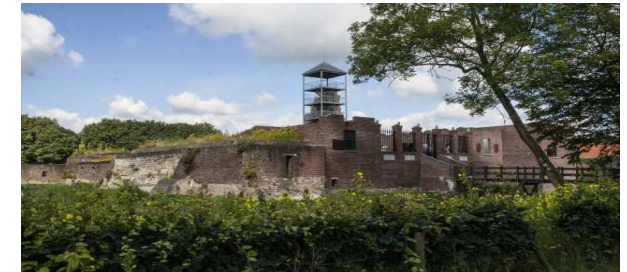
Ruïne Kasteel Huys ter Horst 2016